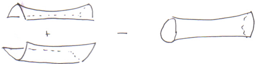
Εικ. 4 Δύο κύλινδροι που έχουν καμφθεί δίνουν μία σαμπέλλα