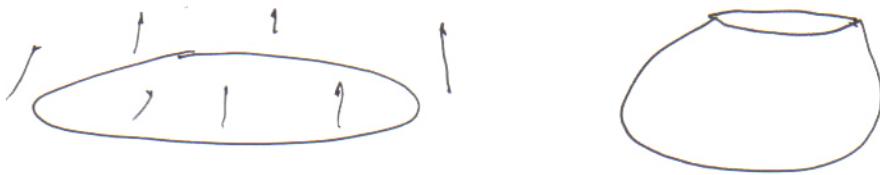
Εικ. 2 Το στομιο (εξωτερικός κύκλος) του μπαλονιού συρρικνώνεται σε σημείο ενώ στη δεύτερη μεμβράνη ο εθωτερικός διαστέλλεται στο επ' άπειρο σημείο